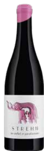
Weingut Strehn 2024 Elefant im Porzellanladen