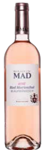
Weingut Mad 2024 Rosé Ried Marienthal Blafränkisch