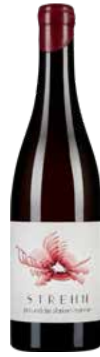
Weingut Strehn 2024 Pia und die starken Männer