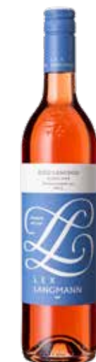
Weingut Langmann vulgo Lex 2024 Schilcher Ried Langegg