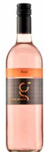
Weingut Greilinger 2024 Rosé