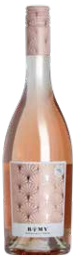
Weingut Piribauer 2024 Romy Rosé RS