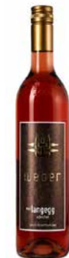
Weingut Weber 2024 Schilcher Ried Langegg Stainz