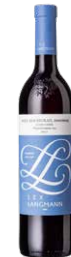
Weingut Langmann vulgo Lex 2024 Schilcher Ried Hochgrail WST