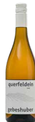
Weingut Gebeshuber 2024 Rosé Querfeldein