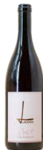
Weingut Lackner 2024 Rosé vom Schiefer