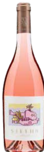
Weingut Strehn 2024 Seerosé