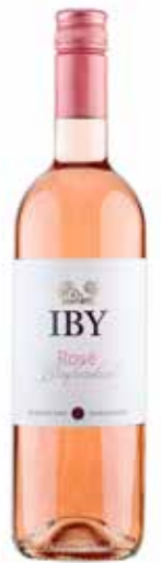
Rotweingut Iby 2024 Rosé Blafränkisch