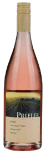
Weingut Prieler 2024 Rosé vom Stein Blafränkisch