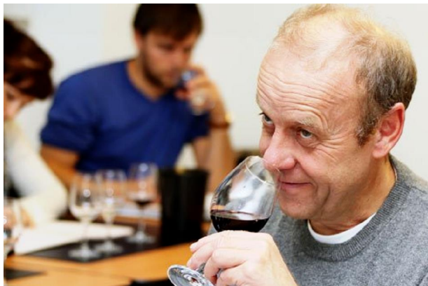
Herbert Stiglmair