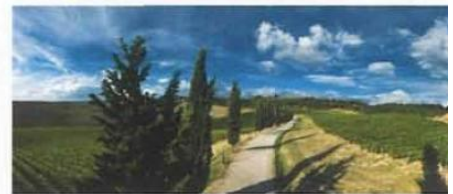
Best of Brunello: Castelgiocondo, Toskana